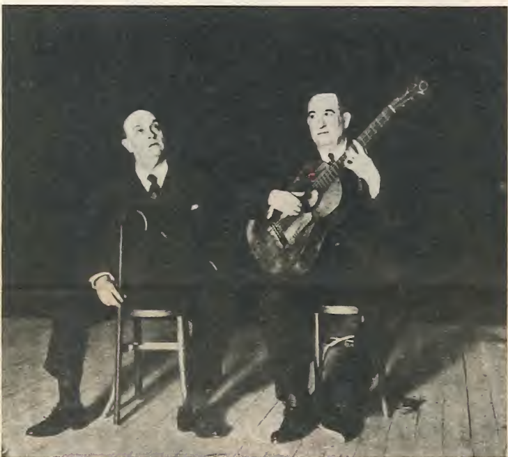
El «cantaor», en una actuación con el guitarrista Montoya.

res» más notables que hasta entonces se habían conocido nunca cobraron más de diez pesetas de jornal...». Y añade, refiriéndose al éxito del joven «cantaor»: «Todos los notabilísimos artistas de la época de Chacón prescindieron de sus derechos de antigüedad y acordaron cantar por delante